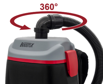
360° Drehgelenk, grenzenlose Beweglichkeit.