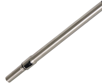
Edelstahl Teleskoprohr 0,6 – 1,0 m. Art.-Nr. 111.133