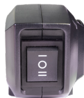
ECO-Modus bei der Akkuversion.