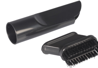
2in1 Fugen- / Polsterdüse. Art.-Nr. 115.127