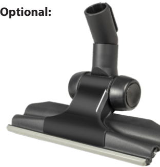
Flachbodendüse 280 mm Art.-Nr. 119.126