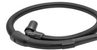
1,3 m Saugschlauch. Art.-Nr. 119.124