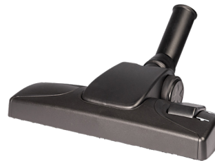
Kombidüse 280 mm Art.-Nr. 114.114