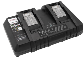
Doppel-Schnellladegerät. Art.-Nr. 119.120